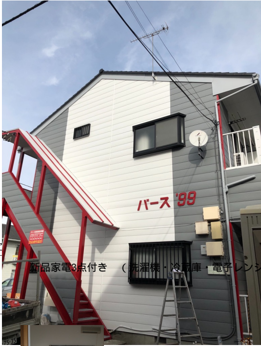
新品家電3点付き（洗濯機・冷蔵庫・電子レンジ）